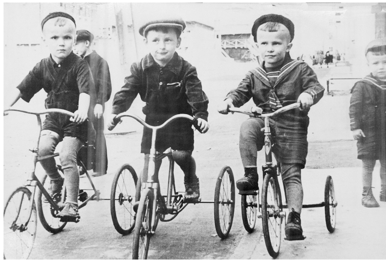
Фото из экспозиции