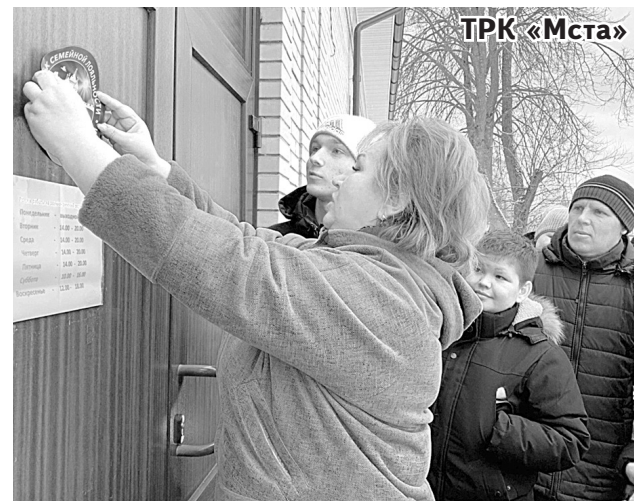
Знак семейной лояльности на дверь Опеченского Дома культуры наклеивает председатель областной Думы Елена Писарева