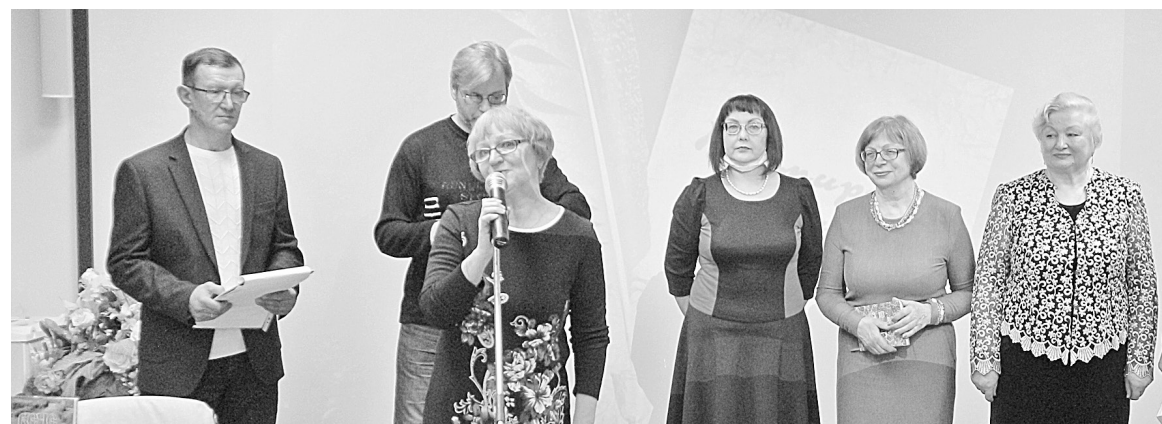
Своё творчество представляют боровичские поэты

Подготовили Михаил ВАСИЛЬЕВ, Наталья ЧУРА.